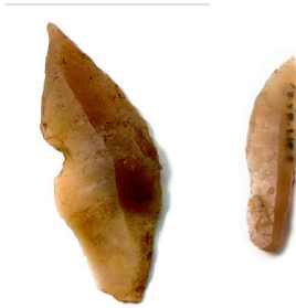
Abajo. Piezas del Paleolítico medio y superior