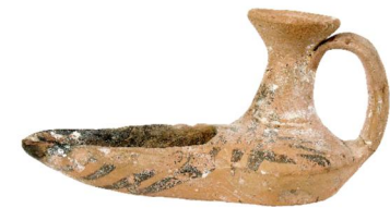
Abajo. Candil de El Castellar (Alcoy)