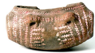
Abajo. Tonelete Neolítico