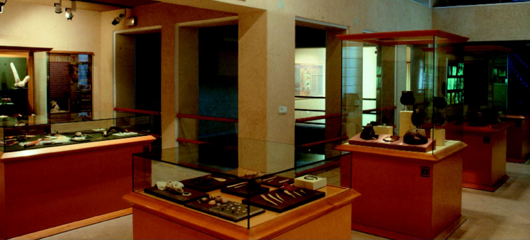
EL MUSEU ARQUEOLÒGIC MUNICIPAL CAMIL VISEDO MOLTÓ